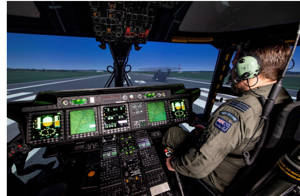
Les équipages des appareils NH90 de la Royal New Zealand Air Force s'entraînent actuellement sur un nouveau simulateur NH90 CAE 700MR situé sur la base Ohakea de la RNZAF.

Le simulateur NH90 de la série CAE 700MR offre un environnement de formation virtuel immersif et réaliste qui est idéal pour l'entraînement aux tâches difficiles, comme les atterrissages sur le pont d'un navire ou en zone confinée. Le simulateur NH90 de la RNZAF est doté d'un système d'affichage visuel à champ de vision extrême (240 degrés à l'horizontale et 88 degrés à la verticale) avec des images générées par le générateur d'images CAE Medallion-6000MR. De plus, la série CAE 700MR comprend un siège dynamique révolutionnaire pour les vibrations et la sensation de mouvement, ce qui permet d'optimiser le réalisme de l'expérience d'entraînement dans un simulateur à base fixe.